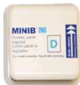
Termostat TH-0343 (reg. A)